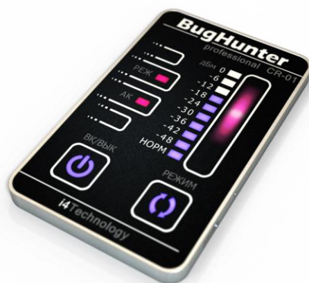
Рисунок 1. - внешний вид изделия

Внешний вид изделия представлен на рисунке 1.